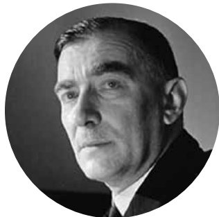
Karol Szymanowski (1882-1937)