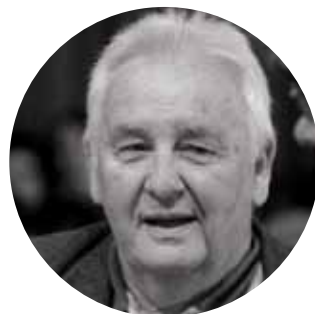
Henryk Mikołaj Górecki (1933-2010)